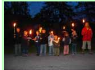
Fackelwanderungen gehören zum ganzjährigen Angebot

Die kleinen Gäste erhalten am Ende ihres Aufenthaltes ein Hubertushof-Bauernhof-Diplom, in dem die durchgeführten Tätigkeiten dokumentiert werden.