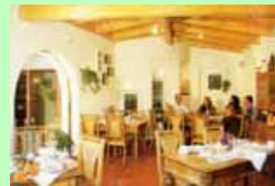
Speisesaal auf dem Hubertushof