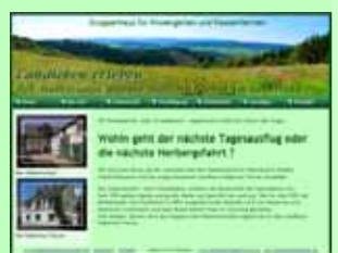
Internetauftritt des Hubertushofes