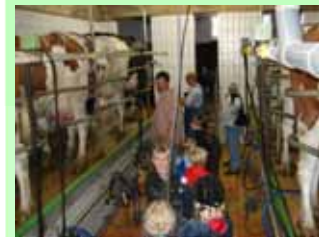
Ein besonderes Erlebnis ist für die Kinder immer wieder das Melken