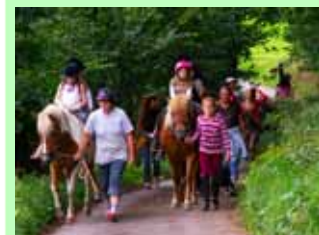
Einführung ins Reiten und anschließende Praxis auf der Weide oder bei einer Reitwanderung in die nahe Umgebung werden vom Hubertushof angeboten