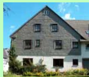
Seitenansicht der Hubertus-Tenne, die das Angebot seit 2004 ergänzt