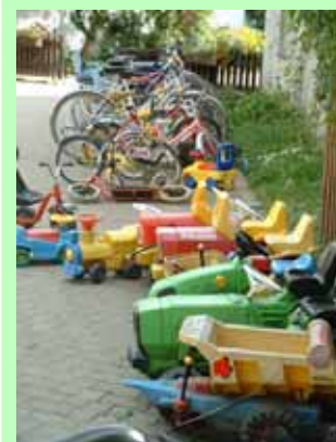
Der „Fuhrpark“ für die kleinsten Gäste