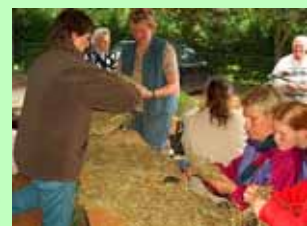
Heubasteln für Große und Kleine haben wir auch regelmäßig im Programm.