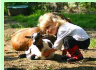
Der Streichelzoo – nicht nur für die ganz Kleinen