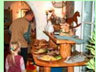
Frühstück und Abendbrot wird reichhaltig am rustikalen Buffet serviert.