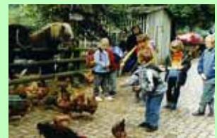
Das Sammeln der Frühstückseier ist eine der Aufgaben unserer kleinen Gäste.