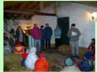
Mittendrin statt nur dabei – bei den Aktionswochenenden werden alle Gäste sowie die Gastgeber in die Spiele einbezogen