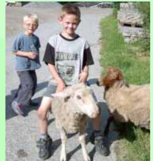
Mit den Tieren spielen wird auf dem Hubertushof groß geschrieben