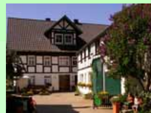
Vorderansicht vom Hubertushof