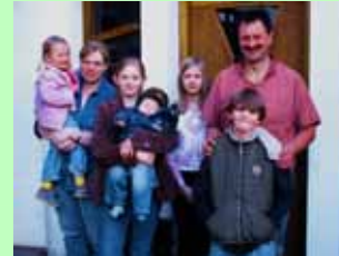
Familie Schörmann führt den Betrieb seit 1991

Sowohl auf dem Hubertushof als auch auf der Hubertus-Tenne finden unsere Gäste neben den sanitären Einrichtungen auf den Zimmern zusätzliche Toiletten und Waschgelegenheiten für die allgemeine Verwendung.