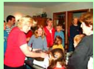
Wir zeigen, wie aus frischer Milch Butter oder Sahne gewonnen wird.