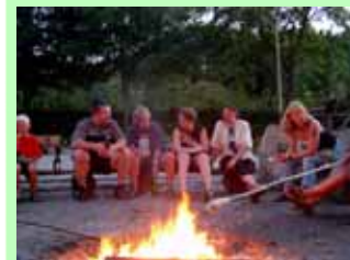
Gemeinsame Abende am Lagerfeuer mit Stockbrotbacken